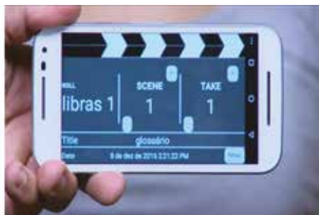
Figura 6 – Indicação da seção filmada com claquete

Com todo o conteúdo gravado, as partes filmadas foram reunidas em um único vídeo, editado em um programa amador e postado no modo privado no canal do YouTube disponível apenas para a orientanda e as orientadoras. Logo o vídeo era revisado pela orientadora surda, que indicava as correções.