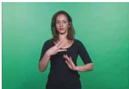
Figura 5 – Indicando o início da gravação do capítulo 3 da monografia