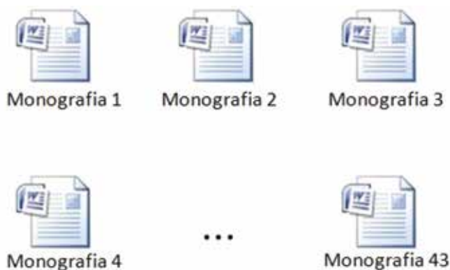
Figura 2 – Exemplo de numeração dos rascunhos

O rascunho, salvo com o nome “Monografia” e com uma numeração, sempre era salvo em 3 locais diferentes: no pen drive , no computador e no e-mail (nuvem). À medida que algo era modificado e/ou acrescido ao texto, o documento (Word) era renumerado. Por exemplo: Monografia 1, Monografia 2, Monografia 3 e etc. Quando a escrita era retomada, sempre partia da última numeração e nunca retomava as anteriores. Os rascunhos numerados eram enviados às orientadoras e estas faziam as correções e devolviam sem renomeá-las. Isso evitou que novos trechos fossem inseridos em documentos diferentes, o que resultaria na perda ou dos acréscimos ou do tempo para lembrar/encontrar onde teriam sido inseridos os últimos acréscimos. Esse procedimento facilitou a comunicação com a orientação, pois sempre recorriam à última numeração. Chegamos até o 43º rascunho.