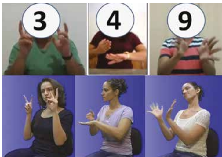
Figura. 3 – Reprodução das entrevistas dos surdos, representados pelos números 3, 4 e 9

As entrevistas revelaram a preferência dos alunos surdos por verem seus próprios colegas ouvintes sinalizando, ao invés do intérprete.